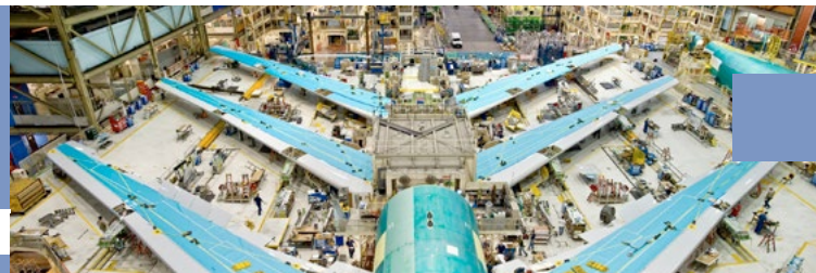
Exportations du secteur Aéronautique en MDH